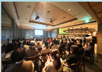
2024年 芸術奨学生勉強会・交流会

2014年より2023年までに220名の美術系の大学院生を支援してまいりました。 給付型奨学金の支給だけでなく、大学院を卒業してからも「作品の発表」「学び」「出会い」等の機会を提供いたします。