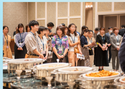
2023年 神山財団10周年記念パーティー

日本の明るい未来のために、才能溢れるみなさんが 文化・芸術分野で大いに活躍できるよう、 この支援プログラムを活用していただければ幸いです。